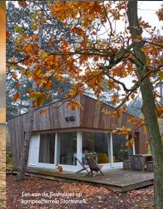
Een van de Boshuisjes op kampeerterrein Stortemelk.