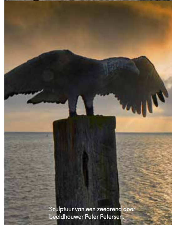
Sculptuur van een zeearend door beeldhouwer Peter Petersen.